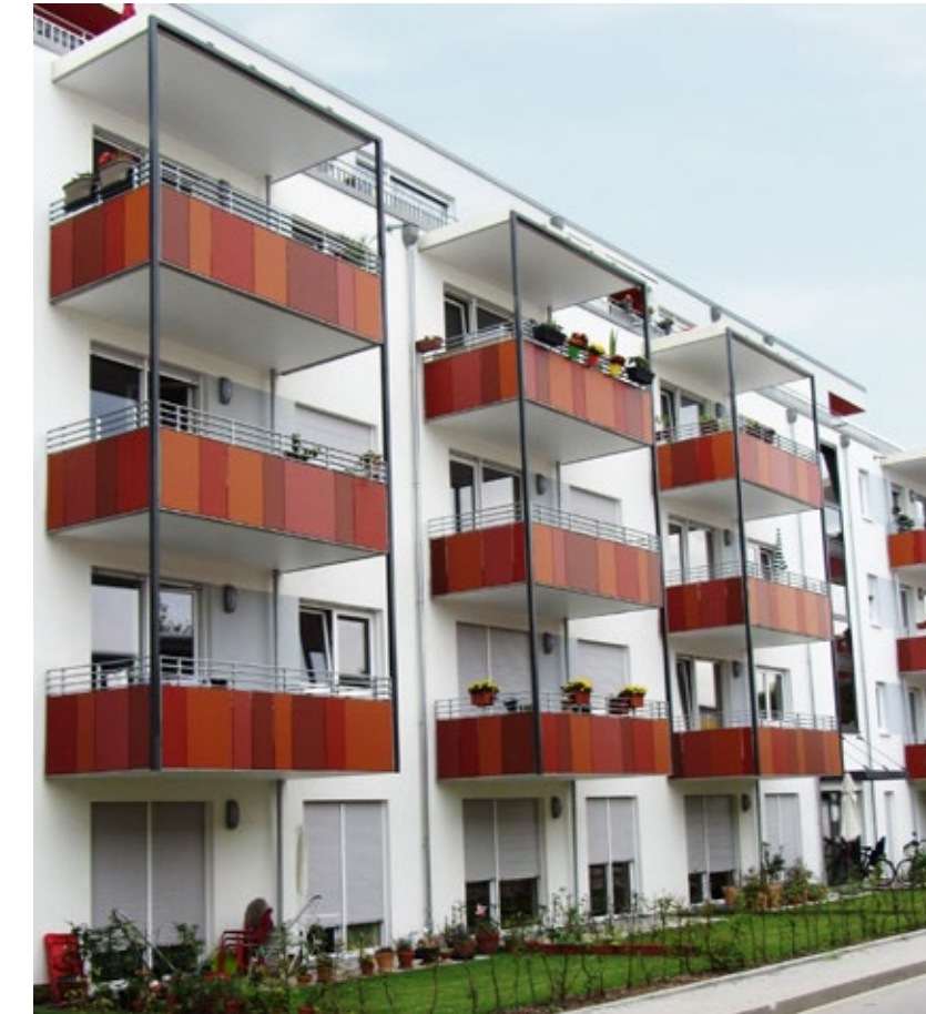
Wohnanlage | Heidelberg Deutschland

Alle Trespa®-Produkte werden unter Extrembedingungen getestet. Ein Muster jedes Trespa® Meteoron® Dekors wird einem Klima ausgesetzt, (Sonne, Regen und Luftfeuchtigkeit) das mit dem in Florida herrschenden Klima gleichzusetzen ist. Trespa bietet eine auf 10 Jahre beschränkte Produktgarantie. Bitte richten Sie sich für weitere Informationen an Ihren lokalen Vertriebsmitarbeiter.