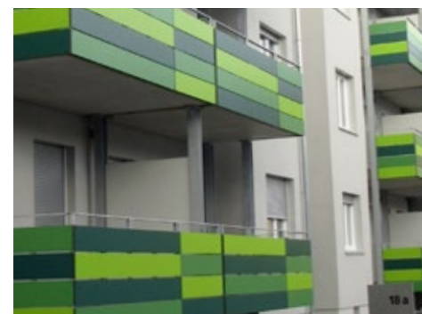
Angerhof | Augsburg | Deutschland