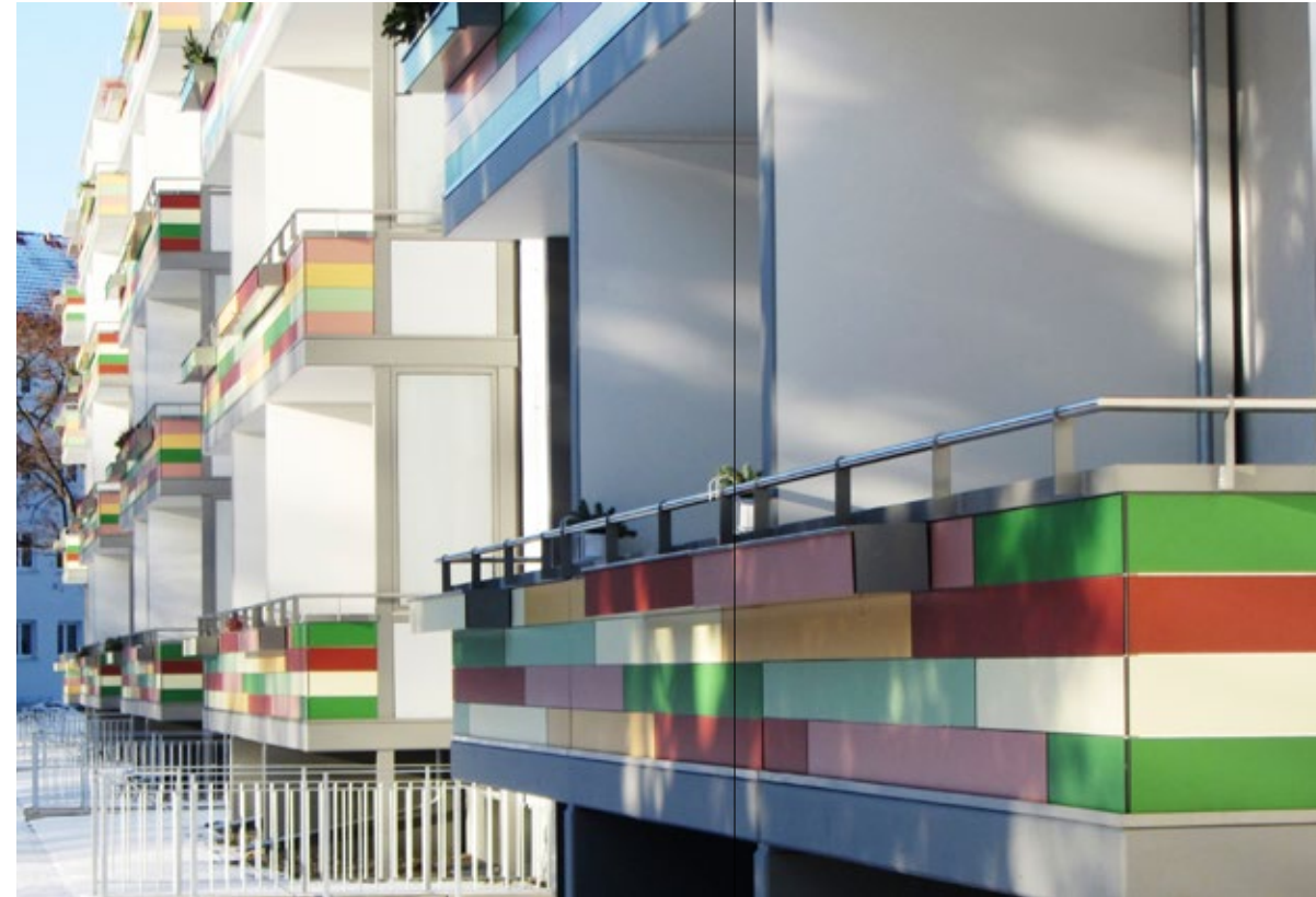
Wohnanlage | Dresden | Deutschland | Keine Standardlösung