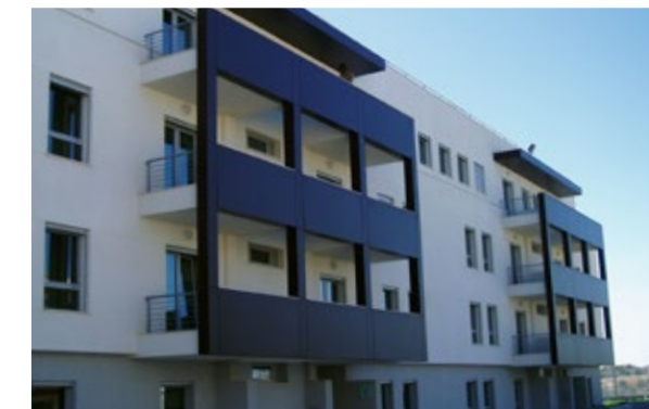
Wohnanlage | Lissabon | Portugal