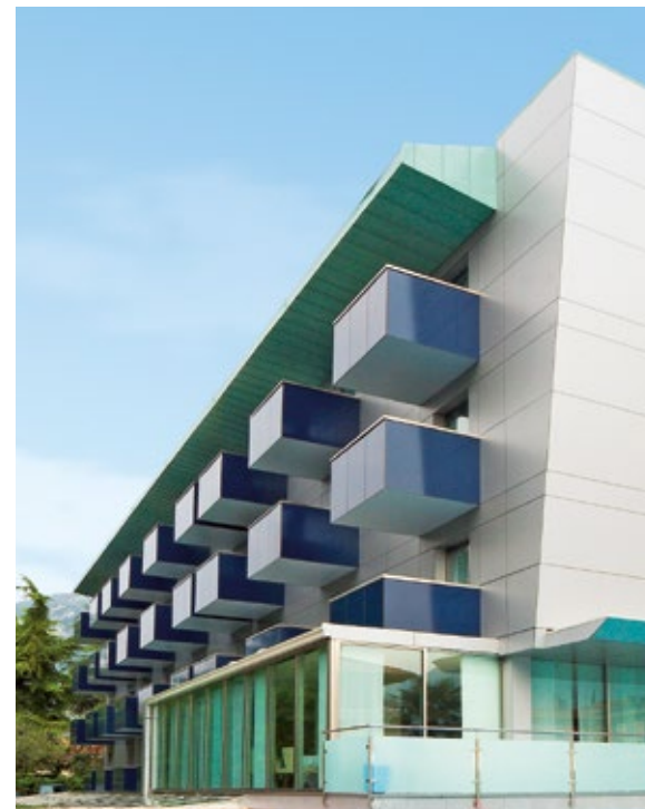
Hotel Caravel | Torbole | Italien

Neubau- oder Renovierungsprojekte für Wohngebäude oder gewerbliche Gebäude bieten Herausforderungen für den Immobilieneigentümer. Ein Balkon ist längst nicht mehr nur ein Balkon, sondern eine Erweiterung eines Innenwohnbereichs in die Außenwelt. Die Auswahl von Fassadenelementen für Balkone ist mehr denn je eine Verbindung von Funktionalität und Ästhetik. Seit über 50 Jahren unterstützt Trespa Designer, Bauunternehmer und Immobilienbesitzer bei der Planung und Realisierung von anspruchsvollen und nachhaltigen Balkon- und Fassadenlösungen.