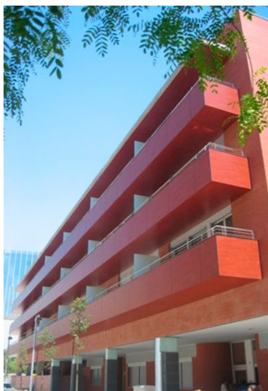
Wohnanlage | Barcelona | Spanien

“Zusätzlich zur vielfältigen Ästhetik sind Trespa® Meteón® Platten sehr langlebig und stellen außerordentlich hochwertige Außenverkleidungen dar. Trespa® Meteón® sieht auf viele Jahre hin ansprechend aus und trägt zu schönen und langlebigen Balkonen bei.”