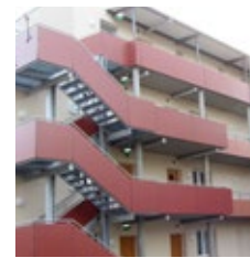
Seniorenwohnheim Hannover-Stöcken | Deutschland