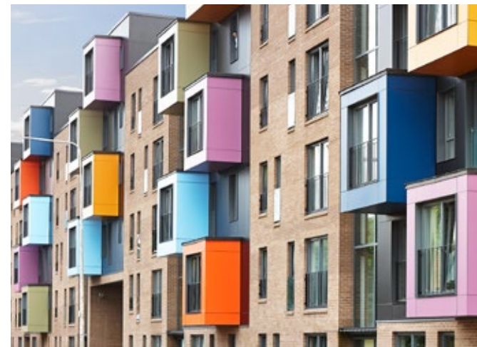
Wohnanlage | Glasgow | Vereinigtes Königreich England

DAS DESIGN EINES GEBÄUDES ENTSTEHT IN EINEM PROZESS ZWISCHEN ARCHITEKT, EIGENTÜMER UND BAUUNTERNEHMER. ALS SPEZIALIST FÜR AUSSENVERKLEIDUNG HILFT IHNEN TRESPA DABEI, DIE RICHTIGEN ENTSCHEIDUNGEN ZU TREFFEN.