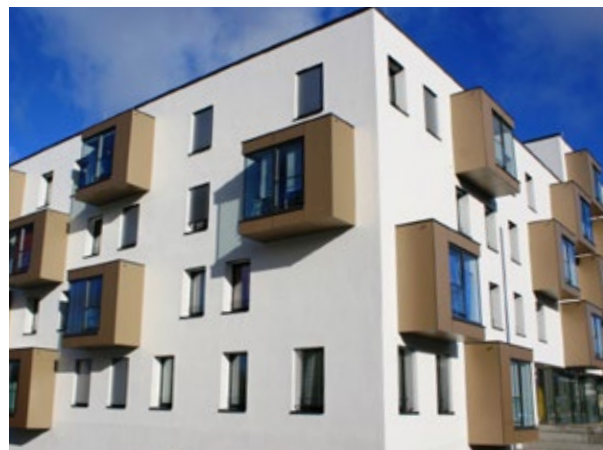
Wohnanlage | Hof | Deutschland